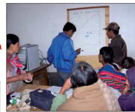
Campeños de Camillaya (La Paz), elaboran un mapa parlante para ubicar los recursos naturales de su comunidad.