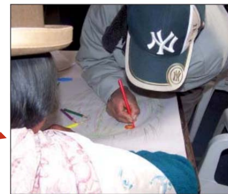
Campeños recurren al dibujo para representar y documentar sus experiencias sobre bioindicadores de clima. El Alto, departamento La Paz.