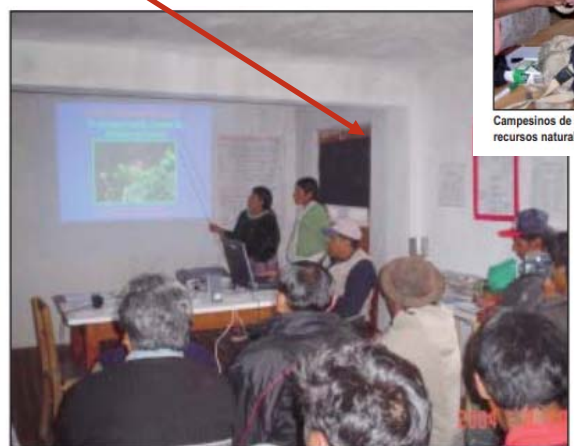
Mujeres de la Organización "Kollamarca" de la comunidad de Camillaya (La Paz) presentan sus experiencias sobre plantas medicinales en un intercambio de experiencias con campesinos de Corani Pampa (Cochabamba).