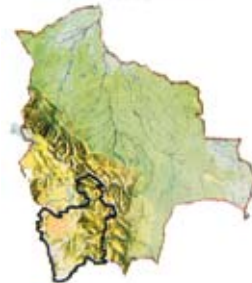
POTOSÍ EN BOLIVIA