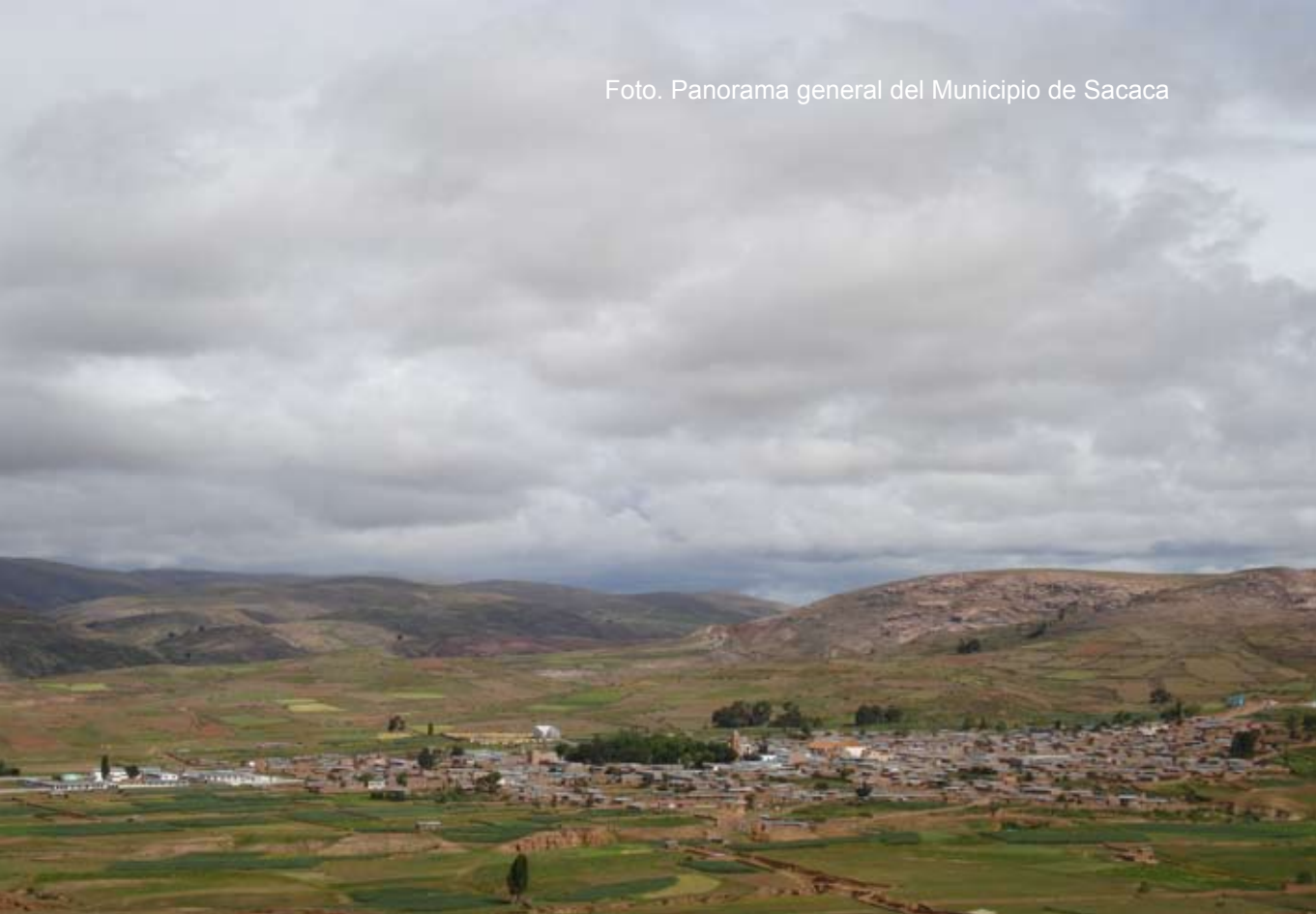
Foto. Panorama general del Municipio de Sacaca