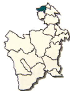
PROVINCIA ALONZO DE IBAÑEZ EN POTOSÍ