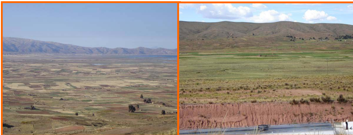
Comunidad Chambi Taraco

La comunidad CHAMBI TARACO, pertenece al municipio de Taraco, de la provincia Ingavi y la comunidad COLLOCOLLO pertenece al municipio Laja de la provincia Los Andes, esta situado a las faldas del cerro, y se puede diferenciar claramente tres zonas denominadas: Cerro, carretera y pampa.